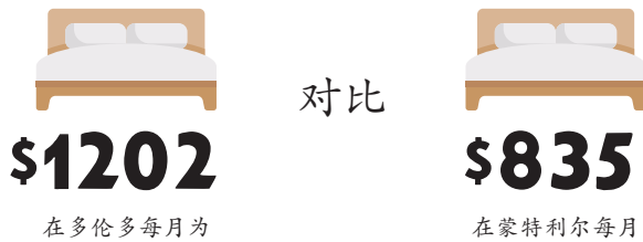
一卧室公寓的平均月租金

与魁北克(9.0%), 阿尔伯塔 (11.4%) 和不列颠哥伦比亚省 (14.9%) 相比, 安省不能找到满意的可以负担得起的住房的家庭在加拿大占最高比例 (15.3%)。在大多伦多地区, 大约 20% 的家庭 (5分之1) 得不到经济适用房。与蒙特利尔的一卧室公寓的平均花费$835 相比, 在多伦多, 一卧室公寓的平均月租金为$1202。